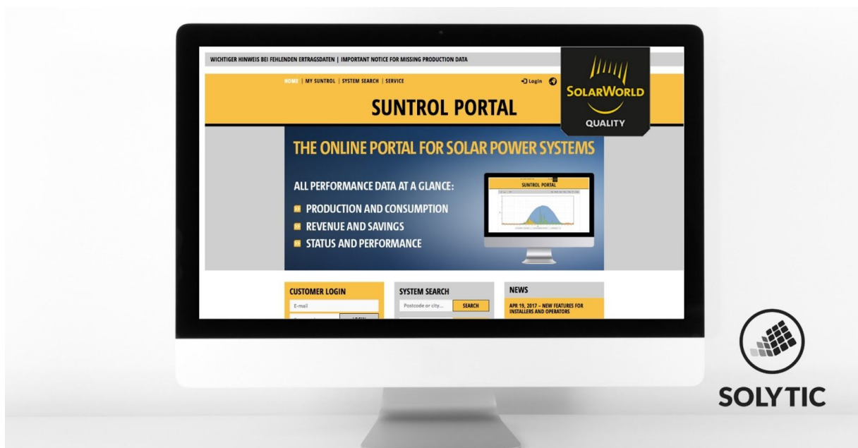
Bild 1: Ab 8. März 2019 übernimmt Solytic das Monitoring-Portal Suntrol von der insolventen Solarworld.

Solytic wurde 2017 in Berlin gegründet. Das 30-köpfige Unternehmen entwickelt intelligente Software für die technische Betriebsführung von Photovoltaikanlagen. Die kostengünstige Lösung des Unternehmens kommunizieren ertragsrelevante Fehler automatisch mittels eines Ticketsystems an die Anlagenbetreiber oder die Betriebsführer, um die optimale Leistung der PV-Systeme sicherzustellen. Durch diesen höheren Automatisierungsgrad reduziert Solytic die Kosten für Anlagenbetreiber und erhöht dank einer intelligenten Wartung die Anlagenerträge. Darüber hinaus lassen sich mit der Software auch Betriebsberichte und Portfolio-Ansichten erstellen. Die herstellerunabhängige Lösung bietet mehrere Benutzeroberflächen, kann mit jeder Anlage verbunden werden und ist auch als White-Label-Lösung erhältlich.